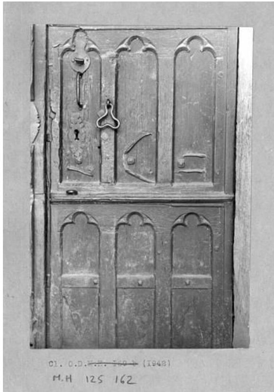
Détail des vantaux